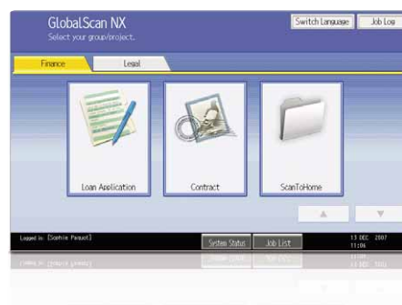
Interface Gráfico do Utilizador fácil de utilizar.

O nosso intuitivo GlobalScan NX otimiza o seu fluxo de trabalho através de uma digitalização e distribuição flexíveis. Através de um Interface de Utilizador Gráfico (GUI) fácil de usar, predefina e personalize ícones para os seus formato de documentos e fluxo de trabalho. Agora, é possível digitalizar através de um só passo a partir do painel de controlo dos MP C2050/MP C2550.