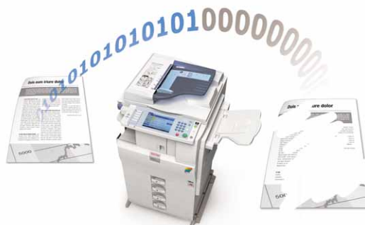
HDD Data Overwrite.

As funcionalidades de autenticação e encriptação protegem todos os seus dados confidenciais. Os MP C2050/MP C2550 são compatíveis com pacotes opcionais de segurança tais como HDD Data Overwrite, Kit de Protecção de Cópias Confidenciais, Placa de Autenticação e Libertação Segura para Impressão.