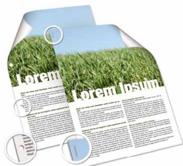
Fura e agrafa toda a sua produção

Para os MP C2050/MP C2550, foi desenvolvido um original e exclusivo finalizador interno para 500 folhas. Agrafa e fura os documentos produzidos. Adicione-o às excelentes qualidades de impressão e capacidade de manuseamento de suportes de impressão do seu equipamento e passa a ter o parceiro de produção de escritório perfeito. Limite o recurso aos documentos produzidos externamente e passe a produzir internamente um sem-número de documentos com uma apresentação profissional.