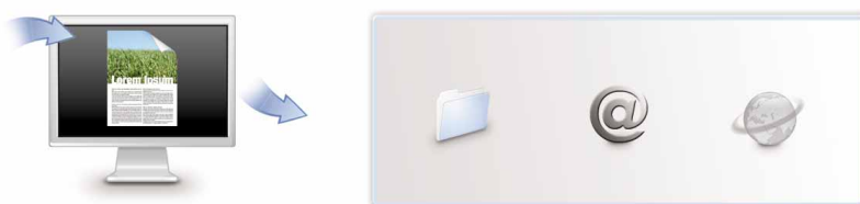
Pode fazer scan to e-mail, folder e URL com o simples premir de uma tecla